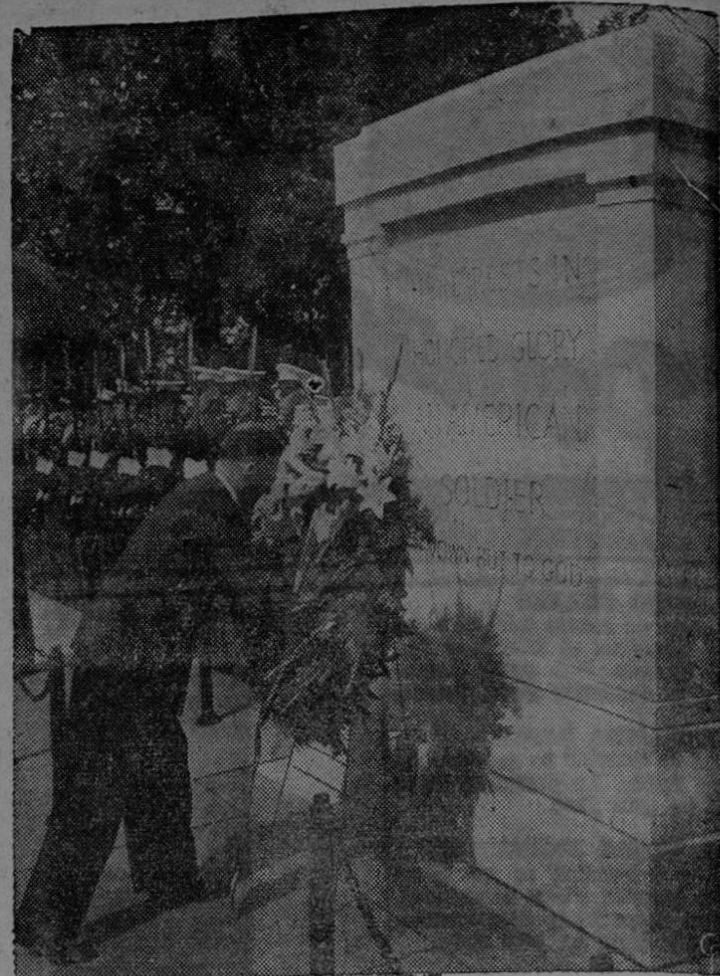
El Canciller de Austria, Dr. Leopoldo Figl coloca una corona en la tumba del soldado desconocido en el cementerio nacional de Arlington, Virginia. Esta es la primera visita que hace Figl a los Estados Unidos. (INF).